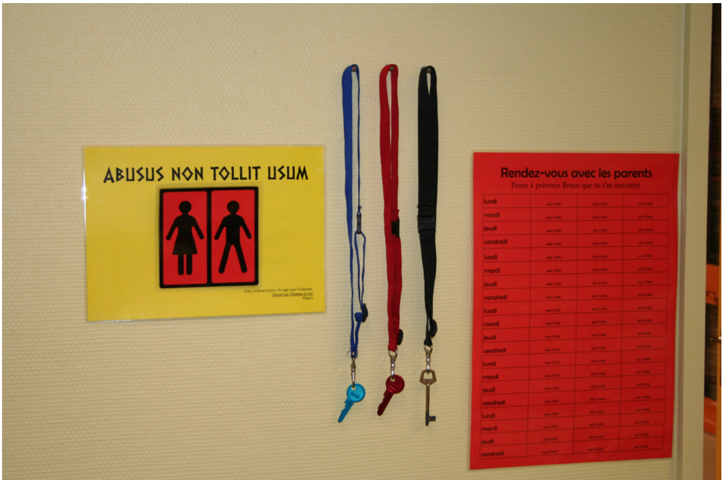
Si vous avez bien suivi, là, vous devriez vous dire : « Tiens, il n'a pas pris la clef ! »