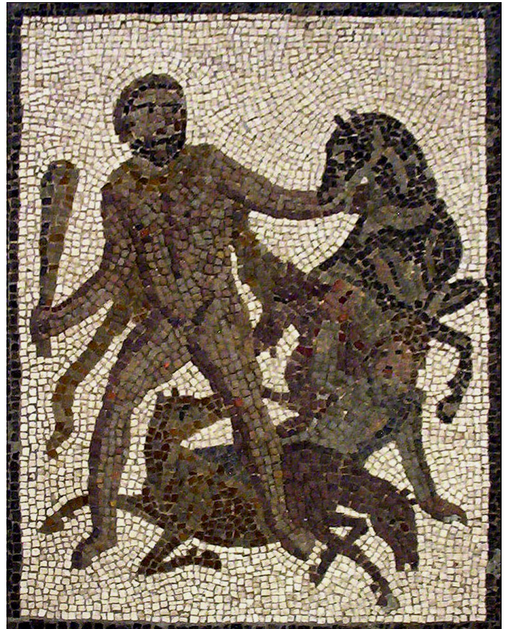
Hercule et les caavales de Diomède, détail d'une mosaïque du III e siècle, Valence (Espagne).