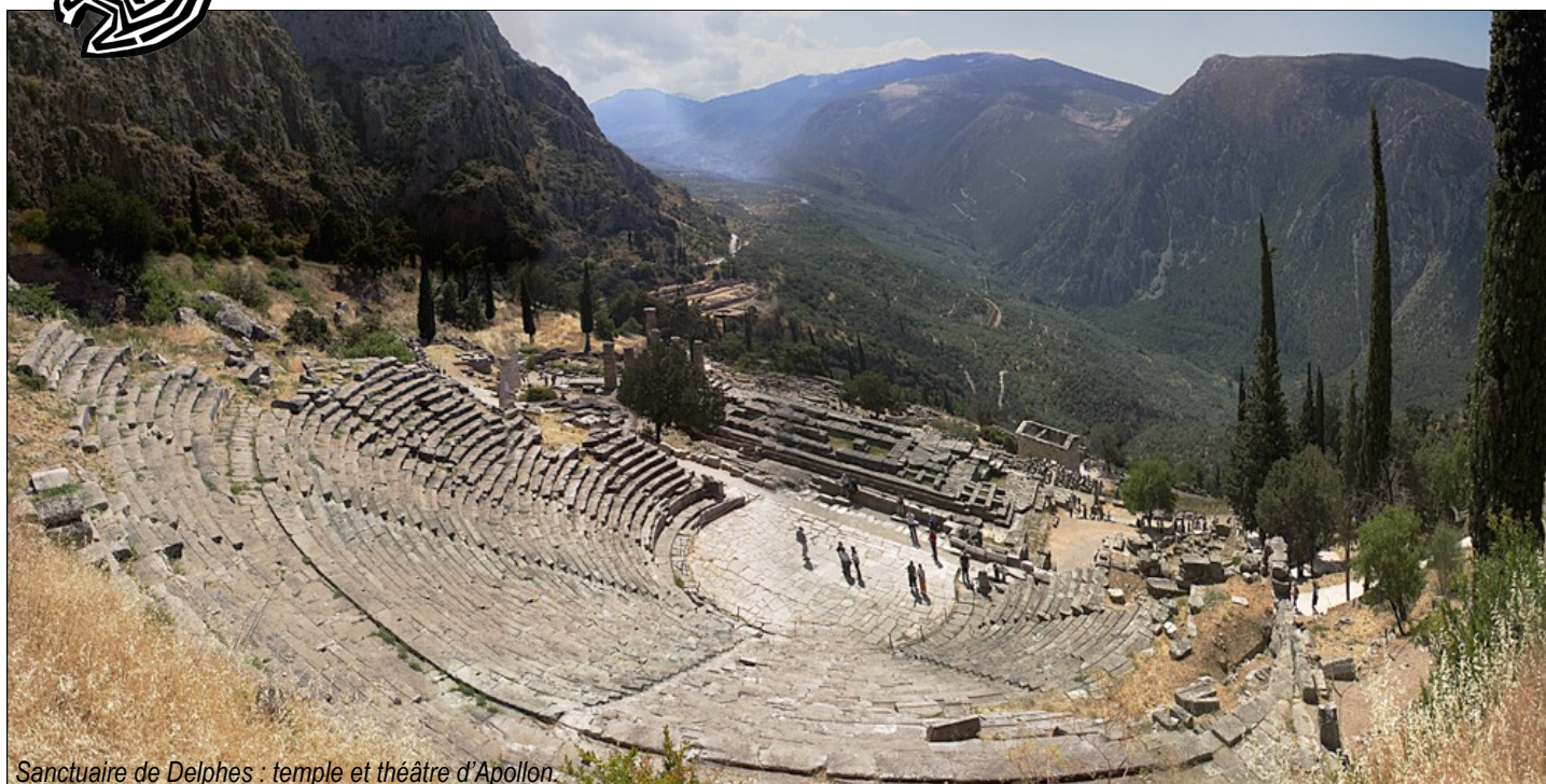
Sanctuaire de Delphes : temple et théâtre d'Apollon.

A Colorie sur le plan et sur la photographie, en jaune le théâtre et en rose le temple.