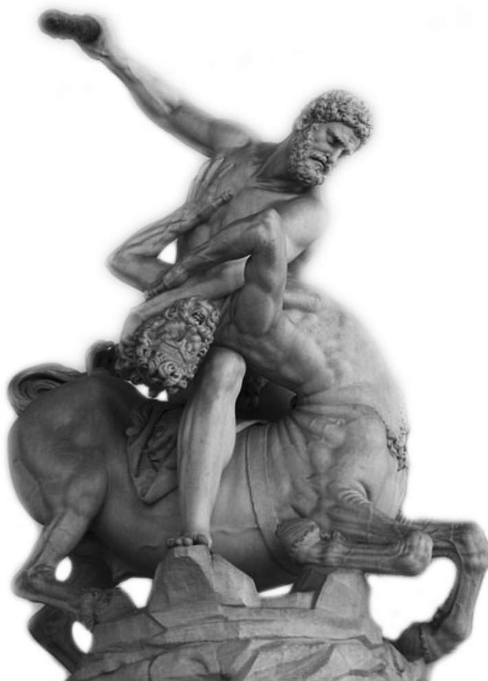
Héraclès tuant le Centaure, Piazza della Signoria, Florence (Italie).

B D'où les armes d'Héraclès proviennent-elles ?