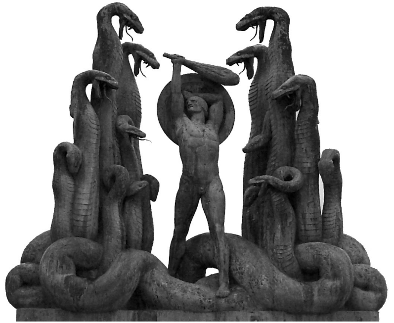
Héraclès et l'hydre de Lerne (bronze, début XX e siècle), Rudolf Tegner (1873 – 1950).