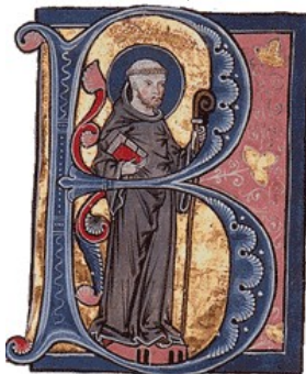
Bernard de Clairvaux représenté dans une lettrine. →

Pour information : une lettrine est une lettre initiale majuscule décorée de grande taille qui débute un texte ou un paragraphe. Les moines du Moyen Âge cultivaient l'art de la lettrine dans leurs enluminures (peintures ou dessins qui accompagnaient les textes manuscrits).