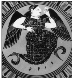
Éris (VI e siècle av. J.-C.)

Une pomme de discorde désigne un sujet de désaccord.