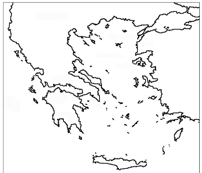
Carte de la Grèce et de ses îles

Colorie les terres en jaune et les mers en bleu clair.