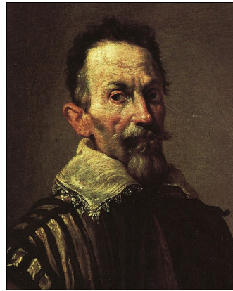
Claudio Monteverdi peint par Domenico Fetti vers 1620.

Né à Crémone, il eut une formation musicale et apprit à chanter ainsi qu'à jouer de l'orgue et de la viole . Après avoir passé une vingtaine d'années à Mantoue, après la mort de sa femme, il devint maître de chapelle à Venise et continua à produire de nombreuses œuvres. Plus tard, en 1632, après la mort de son fils, il devint prêtre mais poursuivit ses créations musicales.