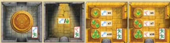
Salle de départ