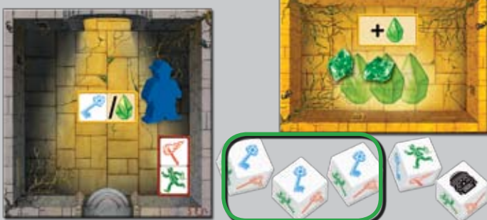
Salle de sortie

Exemple: Frank a obtenu les 3 clefs requises et parvient donc à s'échapper du temple.