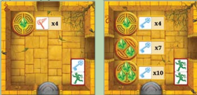
Salle dotée d'1 symbole de joyau

Vous trouverez deux types de salle où activer des bijoux magiques: Quand un joueur se trouve dans une