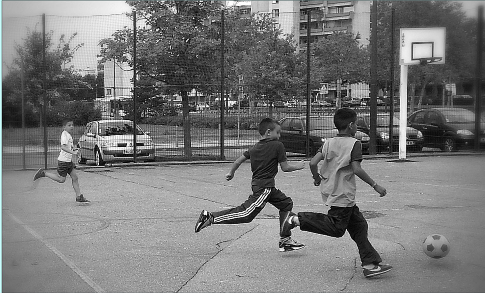
Bataille pour le contrôle du ballon lors du tournoi de football organisé mardi 9 septembre au sein de la classe.

N ous entamons cette semaine un travail quotidien de longue haleine sur les temps géologiques (portant essentiellement sur le Mésozoïque, l'ère au cours de laquelle ont vécu les dinosaures).