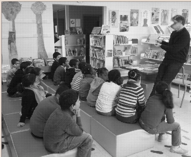
Bibliothécaire, un métier surprenant...

Après le décloisonnement de préparation du spectacle (théâtre, cirque, capoeira...), nous lisons un nouveau chapitre des aventures de Tobie Lolness.