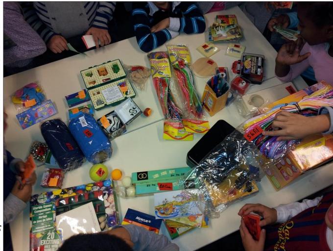
Quelques objets proposés lors du marché intérieur.