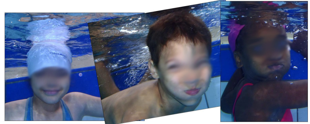
Quelques uns des élèves qui n'hésitent pas à ouvrir les yeux sous l'eau.