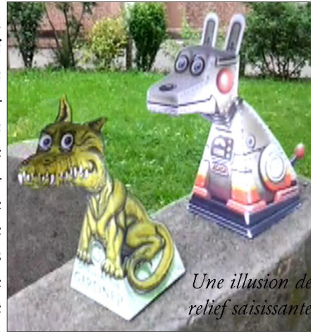
Une illusion de relief saisissante

Nous voyons en quoi consistait la momification puis, après le Quoi de neuf ? , avançons sur le plan de Travail. Nous étudions les principales fonctions d'un logiciel de retouche d'images (réglages de luminosité et de contraste, principes d'un masque, du détourage et du tampon de duplication). Le conseil de classe est suivi d'une nouvelle utilisation des lunettes anaglyphes, après la présentation de différentes illusions de relief créées en papier (à partir du modèle dragon illusion ). Les élèves de CM1 se voient remettre chacun un exemplaire des Lettres de mon moulin d'Alphonse Daudet, envoyé par le ministère de l'éducation nationale.