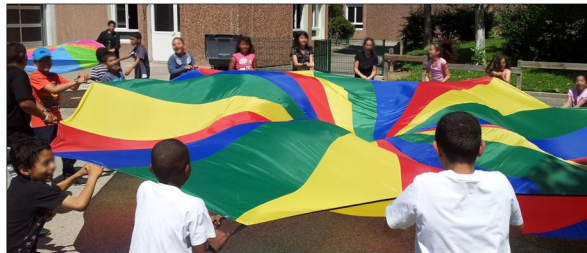
Un parachute décoiffant...

L'étude des différentes classes sociales dans la société égyptienne est suivie du travail personnel, puis de la lecture de La mule du pape d'Alphonse Daudet.