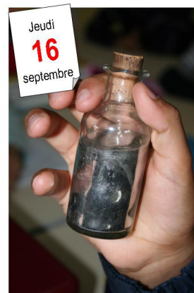
Une grosse bouteille de mercure (qui ne doit pas en sortir).