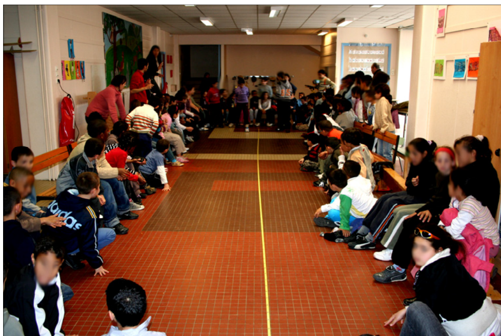
Le concours de voitures propulsées par des ballons de baudruche. (vu par Nicolas)

↳ On trouve le complément circonstanciel de cause en posant la question pourquoi ? après le verbe : Il fuit pour ne pas être assassiné . → Il fuit pourquoi ? Pour ne pas être assassiné .