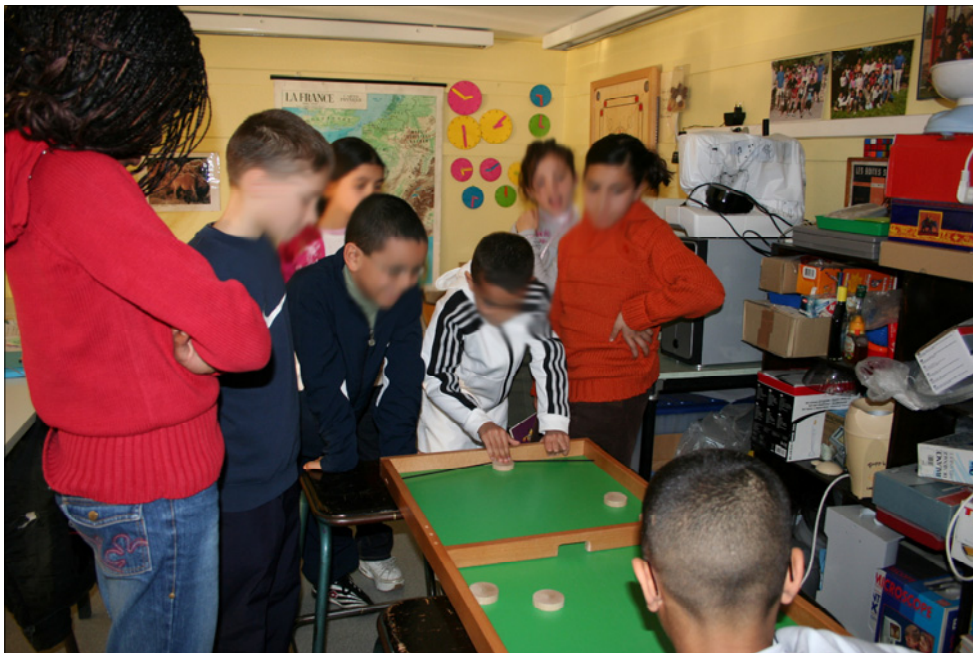
Préparation d'un stand pour apprendre à jouer au passe-trappe.