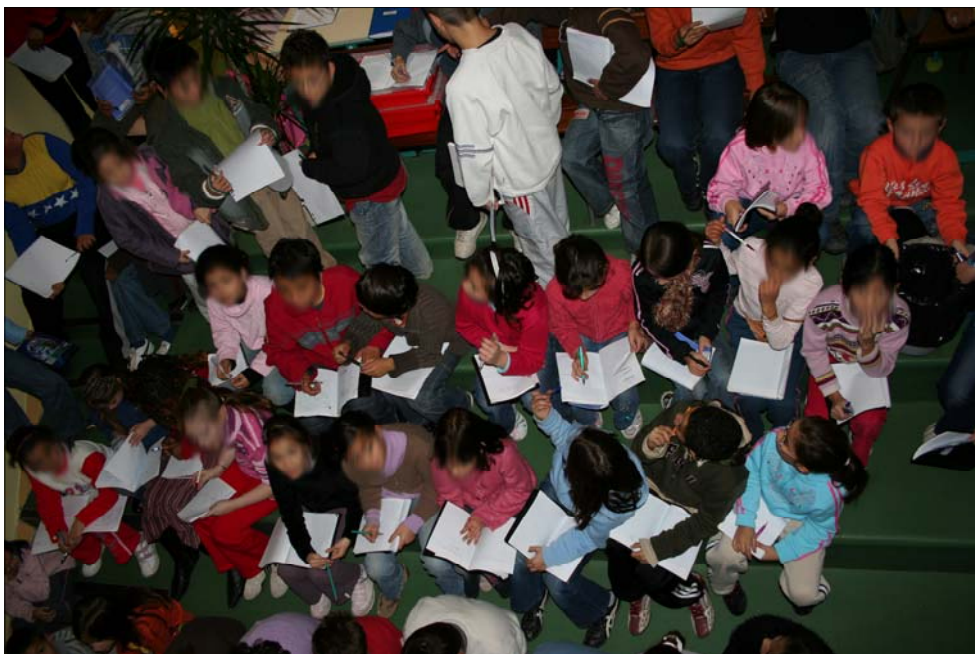
Prêts pour une partie de Kaleidos .