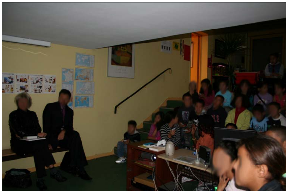
Exploration collective des principales fonctions du TBI.