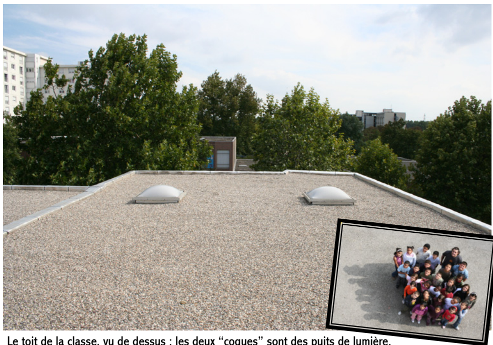
Le toit de la classe, vu de dessus ; les deux "coques" sont des puits de lumière. En encadré : une des photos de la classe de Nicolas.