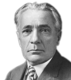
Henri Desgrange Créateur du Tour de France (1865 – 1940)