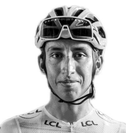
Egan Bernal Vainqueur du Tour 2019 (né en 1997)