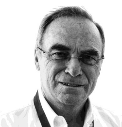
Bernard Hinault Quintuple vainqueur (né en 1954)