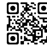
Par Dorothée, Lio et al. (1987)