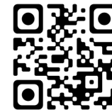
Par Kinita (espagnol - 1965)