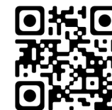
Par Obdurate (2005)