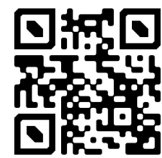
Par Pierre Perret et Blankass (2016)