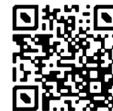
Version originale (1979)