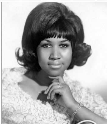
Aretha Franklin en 1968

Aretha Louise Franklin naît le 25 mars 1942 à Memphis, dans le Tennessee (États-Unis). Son père est un pasteur baptiste, ami de Martin Luther King Jr et sa mère est une chanteuse de gospel. Aretha grandit avec ses deux frères et ses deux sœurs, et chante régulièrement dans la chorale de son père.