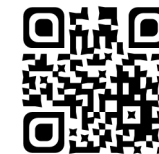
Par Angelina Jordan (2014)