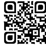
Par Diana Krall (2006)