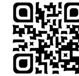
Par Connie Francis Llevame a la Luna (espagnol - 1964)