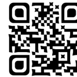
Par Kaye Ballard In other wrds (1954)

Il s’agit d’une chanson d’amour dans laquelle l’interprète demande à celle qu’il aime de l’emmener sur la Lune, de le laisser jouer parmi les étoiles et de lui permettre de voir à quoi ressemble le printemps sur Jupiter et sur Mars. Il reformule ensuite sa demande pour lui signifier qu’en d’autres termes il veut lui tenir la main, l’embrasser et lui dire qu’il l’aime.