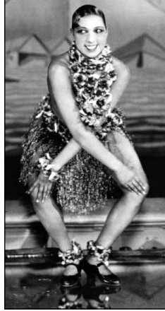
Joséphine Baker dansant le Charleston aux Folies Bergère