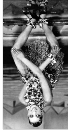
Joséphine Baker dansant le