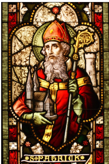
Vitrail représentant Saint Patrick

Cette fête célèbre Saint Patrick (né vers 385 et mort en 461), qui est considéré comme l' évangéliste ★ de l'Irlande. La légende raconte qu'il aurait été capturé par des pirates irlandais, vendu comme esclave et aurait passé six ans dans une cage (ce qui l'aurait amené à se convertir au christianisme ★). Après avoir réussi à s'échapper, il aurait effectué des études religieuses, serait devenu prêtre, puis évêque, et aurait commencé à répandre la religion chrétienne en Irlande. Dans ses prêches (ses discours religieux) il aurait souvent utilisé l'image du trèfle à trois feuilles pour symboliser la Sainte Trinité (un élément important de la doctrine chrétienne). On raconte également qu'il aurait chassé tous les serpents du pays.