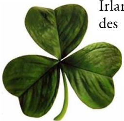
Un trèfle à trois feuilles

La fête de la Saint-Patrick est non seulement célébrée en Irlande, mais également par les Irlandais expatriés ★ et les descendants d' émigrés ★ irlandais partout dans le monde (la parade de New-York attire plus de deux millions de spectateurs chaque année). Sa popularité s'étend également aux non-Irlandais. Les célébrations ( parades ★, regroupements dans des pubs ou des bars...) mettent en avant la couleur verte (habits), la musique et la bière irlandaises (ainsi que, d'une façon générale, les boissons alcoolisées irlandaises : whiskies, cidres...)