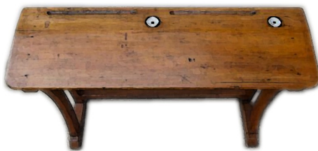
Un bureau d'écolier équipé d'encriers.

À l'école, en France, les enfants apprennent, entre 1850 et 1950, à utiliser la plume de la marque Sergent-Major . Ils possédaient souvent leur propre plumier (une boîte en bois qui servait de trousse) dans lequel ils rangeaient leurs porte-plumes et leurs plumes métalliques. Leurs bureaux ou leurs pupitres étaient équipés de trous dans lesquels étaient placés des encriers de porcelaine régulièrement remplis d' encre violette .